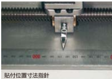
貼付位置寸法指針